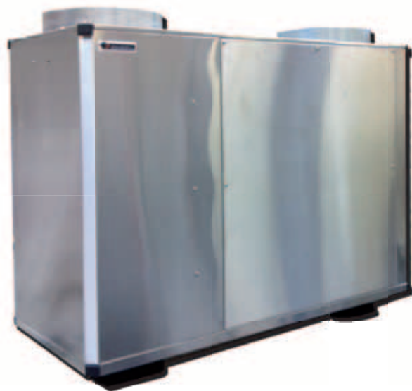
Tableau des caractéristiques RM 55 - I